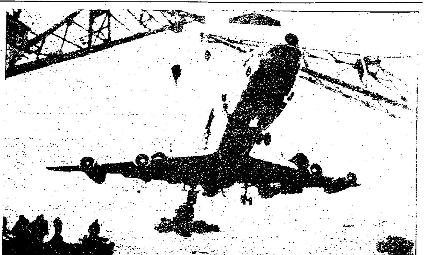
الطائرة اليابانية اغتالة (دي سي-٨) وهي ترابح من مقدمتها من خليج سان فرانسيسكو بعد جوبها - الاضطرابي في مياه الخليج الفلحة وقد نجا ركابها البالغ عددهم ١٠٧ من الموت ويبلغ نفي الطائرة ثمانية ملايين دولار (صورة لاسبكية)

وكل الزين تفر وغرأ البحر المعلم العربي يخالفه الرأي وتقر خبراء جنوا في نزوات البحر خلال مؤثر عقد في القاهرة أخيراً أن المعلم والاجرة المعنية يجب أن تضاف إلى مهارة أحمد الطيبية.